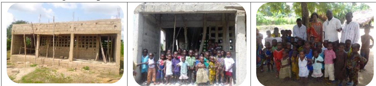
Construction de la maternelle de Hihlagbe du partenaire Togo to children

L'équipe du département du DC a assuré le suivi des travaux de construction d'une classe maternelle dotée de latrine et de citerne en 2014. Ce microprojet financé par les anciens Volontaires suisses membres de l'association « Togo to children » a débuté depuis 2013 ; mais les travaux n'ont été finalisés qu'en 2014 compte tenu de certaines malfaçons constatées au niveau de la dalle ayant entraîné la démolition de celle-ci et son remplacement. Les infrastructures de la maternelle ont été définitivement