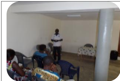
Séance de formation des pépiniéristes d'Agou Kébo Dalavé du projet FEM