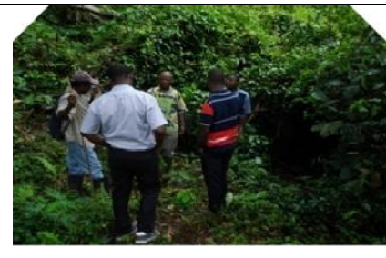
Suivi conjoint des responsables de FEM et de PASYD